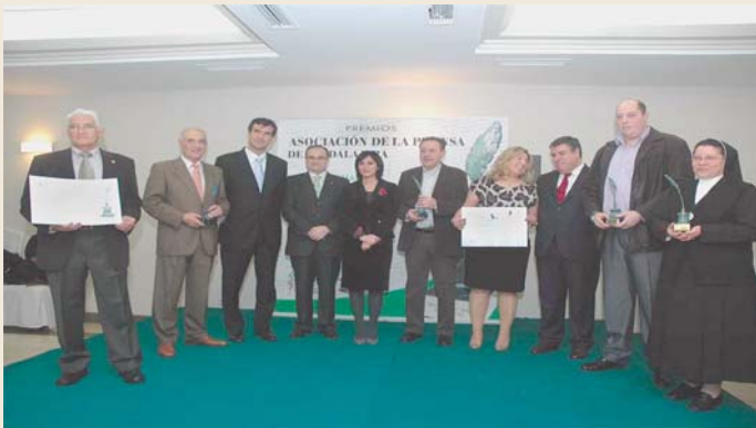
Foto de familia de los premios de la Asociación de Guadalajara

Si algo queda claro es que los periodistas, pese la gran cantidad de grupos empresariales que dominan los medios, se encuentran unidos, al menos en esta importante fecha, en defensa de una profesión cada vez más denostada y maltrecha, recordando y poniendo cara a todos aquellos buenos profesionales de la comunicación que dejaron un brillante legado periodístico.