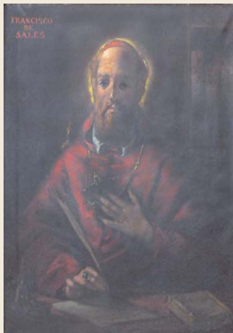
Retrato de San Francisco de Sales

Años después en 1665 fue canonizado por el Papa Alejandro VII y en 1877 recibió el título de Doctor de la Iglesia por la importancia de sus obras y por su vida ejemplar.