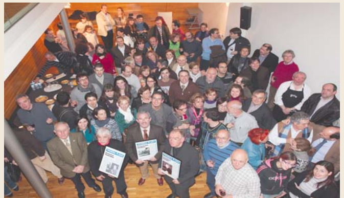
Periodistas de la Asociación de la Prensa de la Rioja